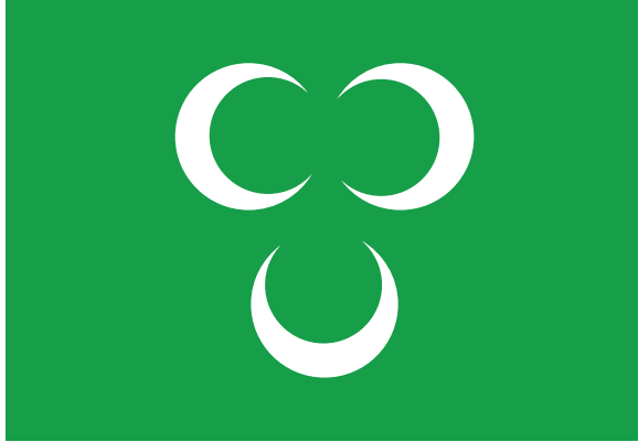
علم السلطان مراد الأخضر.

اتخذ السلطان محمد العلم الأحمر جعل في وسطه دائرة خضراء بيضياً في وسطها ثلاثة أهلة مذهبة التطريز متناسقة الوضع في سطر واحد، ثم أُزيلت تلك الدائرة وحلَّ محلُّها الهلال على المتن الأحمر ولكنَّا لا ندري متى كان ذلك.