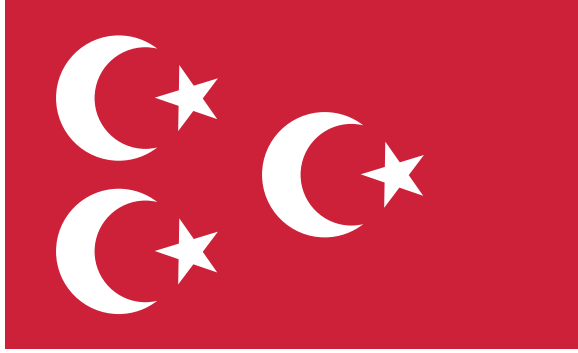
العلم المصري الأحمر ذو الثلاثة الأهلة والثلاثة الأنجم.

وفي أواخر سنة ١٣٣٢ وقعت الحرب العظمى بين الدول وأُعلنت الحماية الإنكليزية على مصر بعد فصلها عن الدولة العثمانية، وتولى عليها الأمير حسين كامل في ثاني صفر سنة ١٣٣٣ متلقبًا بالسلطان، فأخذ ولاة الأمر يفكرون في تغيير العلم كما غَيروا بعض الأنظمة، وأُشيعت عنه إشاعات، فقبل إنهم سيجعلونه أزرق وقيل أخضر، إلى أن استقر الرأي على اختيار العلم الأحمر ذي الثلاثة الأهلة والثلاثة الأنجم الذي كان خاصًا بالأمير منذ العصر الإسماعيلي، فجعلوه علمًا للدولة المصرية وهذه صورته: