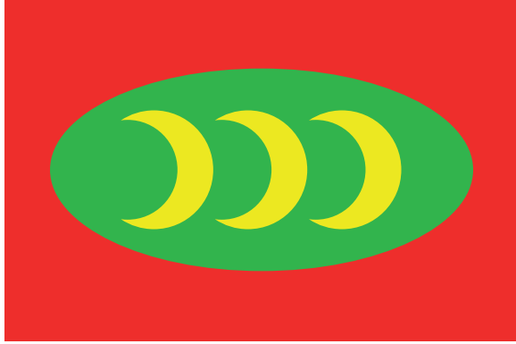
علم السلطان محمد الأحمر ذو الدائرة الخضراء.

فيما يظهر لنا أصلاً للهِلال العثماني كما يقول أصحاب هذا الرأي، بل الذي نرجّحه استنتاجاً من الروايتين أن الهلال كان شعاراً للملكة الشرقية كما كان شعاراً للسلاجوقيين والعثمانيين. فلما فتح هؤلاء القسطنطينية استنتج المؤرخون بعدهم من توافق الشعارين ما نشأ عنه الرأي الأول. وسيبقى هذا الإشكال بلا حلّ حتى يهتدي الباحثون إلى نصّ صريحٍ لثقةٍ من معاصري الفتح.